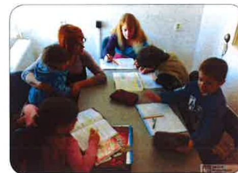
Doučování dětí v Kaplici

Prožili jsme zajímavé odpoledne ve znamení psaní ikon, kde jsme prezentovali svou kulturu, navštívil nás východní sv. Mikuláš. Bezpochyby bezkonkurenční ovšem bylo natáčení krátkého dokumentu o charitě pro Českou televizi, kterého se děti i jejich rodiče účastnili v hojném počtu.