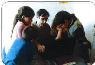
Kurz informatiky v Kaplici

odpoledne, kdy je otevřena klubová místnost, přichází děti samotné či s rodiči. Děti píší za naší pomoci domácí úkoly, opakují si učivo, společně procvičujeme předměty, ve kterých nemají úplně jasno. Děti se formují prostřednictvím řízené hry, diskutujeme nad různými tématy, promýšlíme různé problémy, učíme se prožívat správně vztahy ve svém okolí. Čas je i pro volnou hru. Předškolní děti procvičují grafomotoriku, připravují se k úspěšnému zvládnutí nástupu do školy. Malinké děti společně se svými rodiči cvičí, tancují, procvičují česká říkadla, učí se českým písničkám. Pro dospělé je připraveno vzdělávání v různých