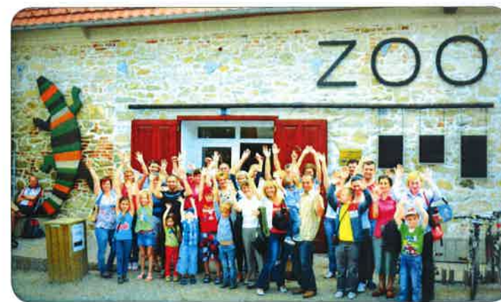
Výlet na krokodýlí farmu