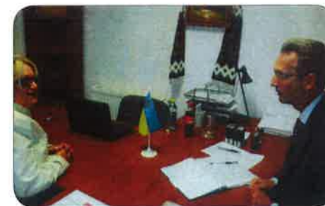
Konzul p. V. V. Lobač na charitě v Liberci

V této přínosné práci hodláme pokračovat i v dalších letech.