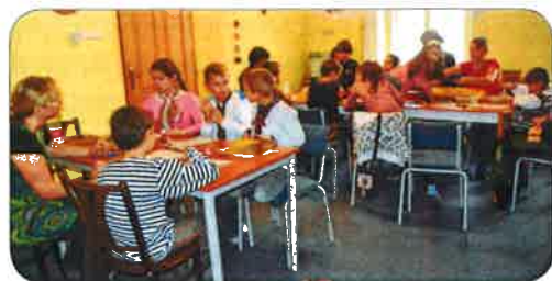
Ikonopisecké odpoledne v Čes. Budějovicích

odpoledne, kdy je otevřena klubová místnost, přichází děti samotné či s rodiči. Děti píší za naší pomoci domácí úkoly, opakují si učivo, společně procvičujeme předměty, ve kterých nemají úplně jasno. Děti se formují prostřednictvím řízené hry, diskutujeme nad různými tématy, promýšlíme různé problémy, učíme se prožívat správně vztahy ve svém okolí. Čas je i pro volnou hru. Předškolní děti procvičují grafomotoriku, připravují se k úspěšnému zvládnutí nástupu do školy. Malinké děti společně se svými rodiči cvičí, tancují, procvičují česká říkadla, učí se českým písničkám. Pro dospělé je připraveno vzdělávání v různých